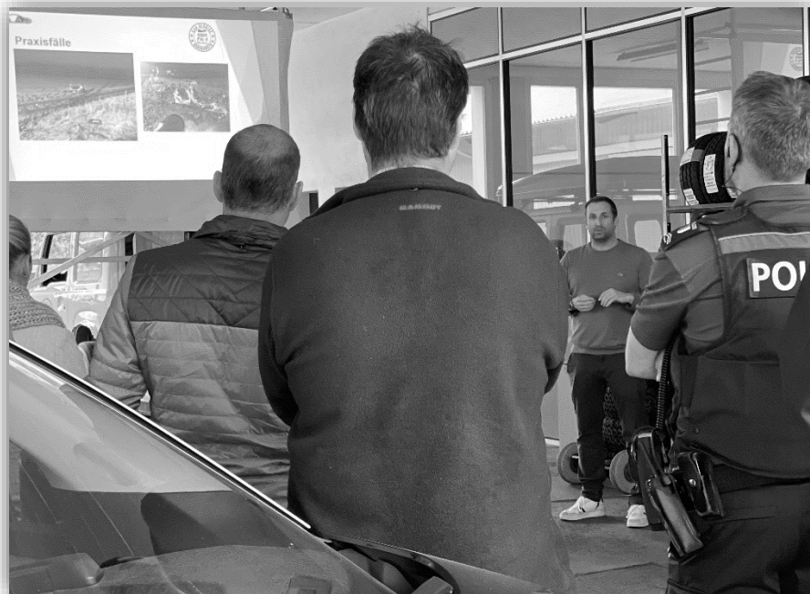
WISSEN SCHAFFT SICHERHEIT. z.B. durch eine von uns organisierten Schulung