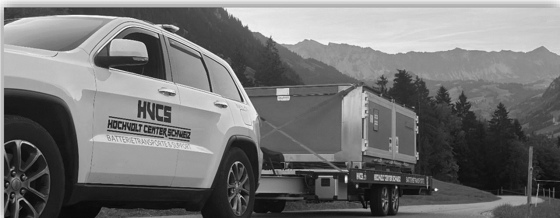
Transport einer Lager-/Quarantänebox

Der Transport von Hochvolt-Batterien und Hochvolt-Fahrzeugen in allen Gefahrenstufen erfordert zum Teil besondere Vorsichtsmassnahmen, spezielle Transportboxen und situative Entscheidungen. Unser top ausgebildetes Team, insbesondere unser geprüfter Gefahrgutbeauftragter verfügen über die entsprechenden Kenntnisse und erledigt auch die benötigten Formalitäten.