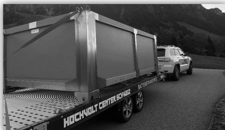
grosse Lagerbox auf dem Weg zum Quarantäneplatz