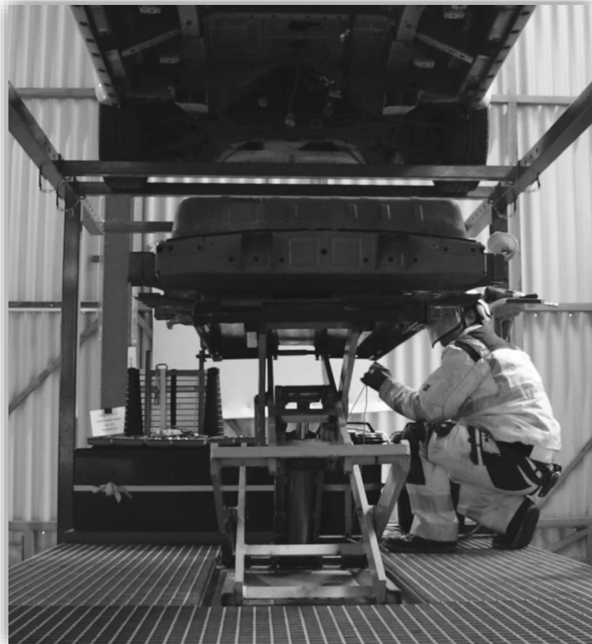
Unser Hochvoltspezialist beim Ausbau einer Hochvoltbatterie