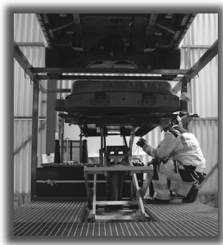
Unser Hochvoltspezialist beim Ausbau einer Hochvoltbatterie