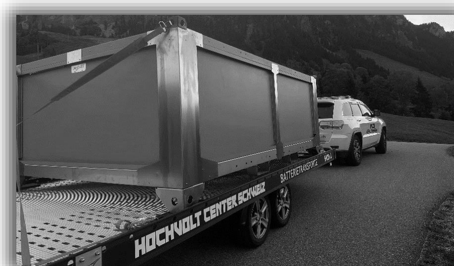
grosse Lagerbox auf dem Weg zum Quarantäneplatz